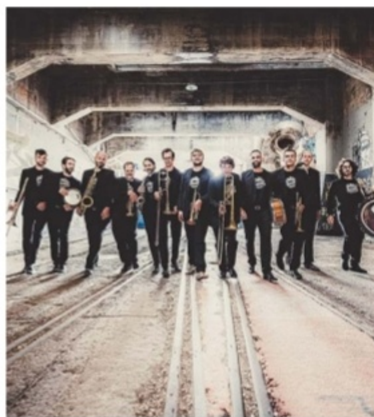
Tüchtiges Berner Gebläse: Traktorkestar