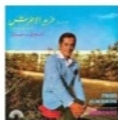
Farid El Atrache Nagham Fi Hayati (We Want Sounds 2023)

Der in Syrien geborene und in Ägypten aufgewachsene Farid El Atrache (1915–1974) war alles: Schauspieler, Komponist, Sänger und vor allem «König der Oud». Zahlreiche Filme sind von ihm erhalten, der frisch remasterte Soundtrack des Blockbusters «Nagham Fi Hayati» aus dem Jahr 1974 lässt erahnen, warum die arabische Kultur den gesamten Mittelmeerraum 1000 Jahre lang dominierte. Die freejazzigen Oud-Soli sind zum Weinen schön. Marianne Berna