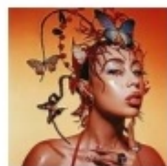
Kali Uchis Red Moon In Venus (Interscope/Universal 2023)