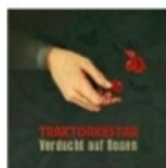
Traktorkestar Verdacht auf Rosen (Trakton 2023)