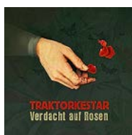
Traktorkestar Verdacht auf Rosen (Trakton 2023)