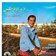
Farid El Atrache Nagham Fi Hayati (We Want Sounds 2023)

Der in Syrien geborene und in Ägypten aufgewachsene Farid El Atrache (1915–1974) war alles: Schauspieler, Komponist, Sänger und vor allem «König der Oud». Zahlreiche Filme sind von ihm erhalten, der frisch remasterte Soundtrack des Blockbusters «Nagham Fi Hayati» aus dem Jahr 1974 lässt erahnen, warum die arabische Kultur den gesamten Mittelmeerraum 1000 Jahre lang dominierte. Die freejazzigen Oud-Soli sind zum Weinen schön. Marianne Berna