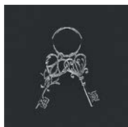
Beach House Become (Bella Union 2023)