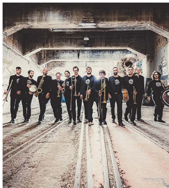
Tüchtiges Berner Gebläse: Traktorkestar